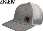
CZAPKA Z DASZKIEM Z SIATKĄ Z TYŁU MC130806200X 68 ZŁ