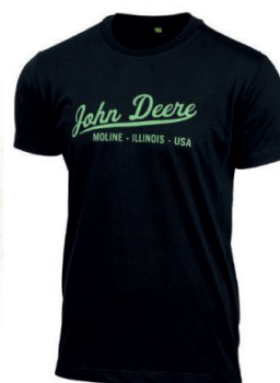
T-SHIRT CZARNY Z NAPISEM MCL2022080 105 ZŁ