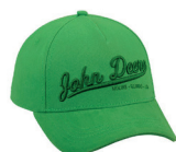
CZAPKA Z DASZKIEM ZIELONA MCL201919011 68 ZŁ