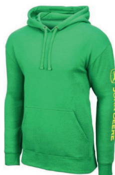
ZIELONA BLUZA Z KAPTUREM MC130219GR 120 ZŁ