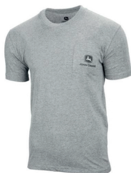
T-SHIRT SZARY Z KIESZONKĄ MC140315CH 77 ZŁ