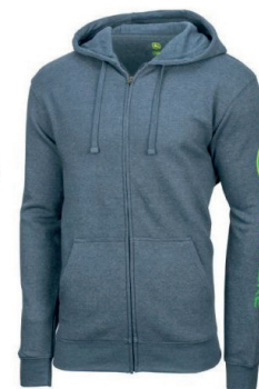
BLUZA ROZPINANA Z KAPTUREM MC130319NV 135 ZŁ

Podane ceny są cenami netto. Liczba przedmiotów objętych promocją jest ograniczona. Promocja trwa do 30.08.2024r, bądź do wyczerpania zapasów.